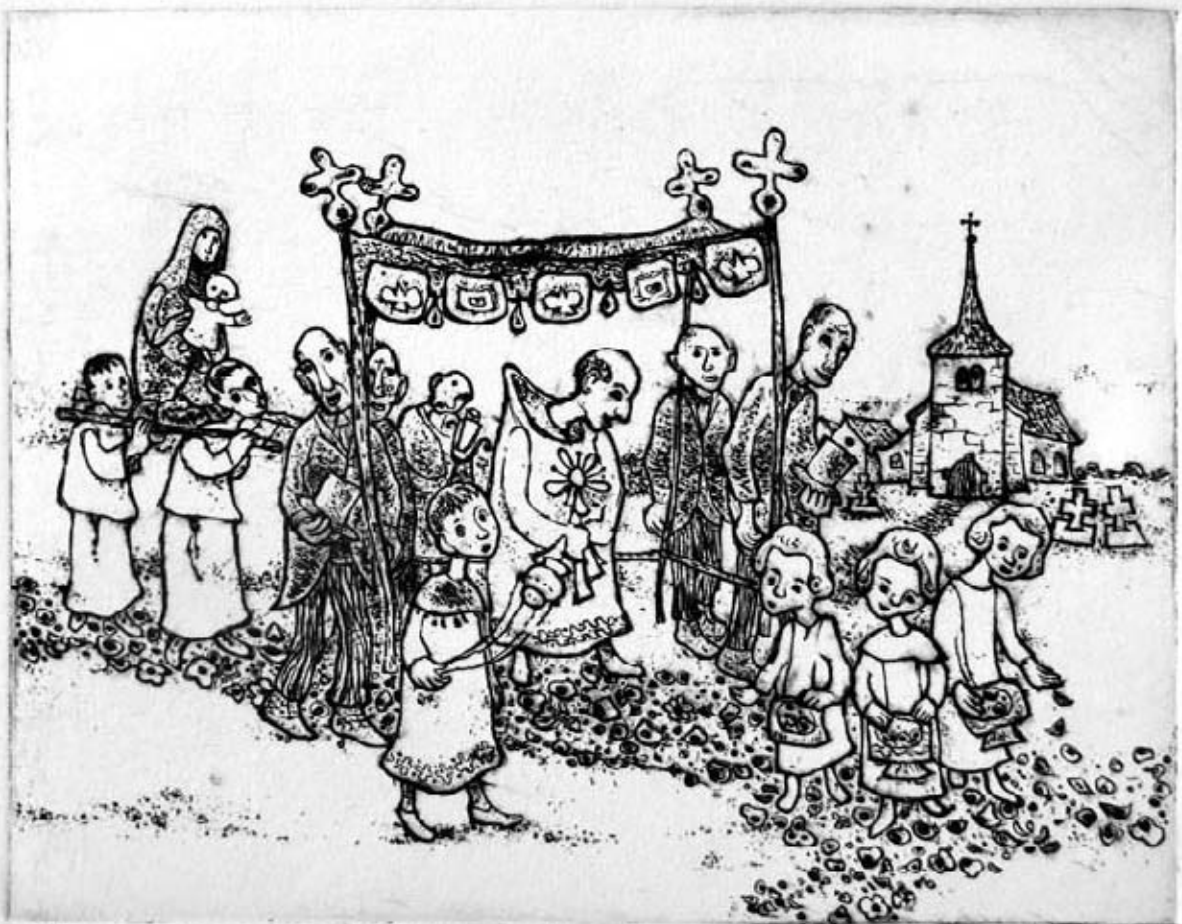
De eenvoudigen van Geest

Op veel werk van Hutschemakers staat één persoon: een man die peren plukt, een man met een koe, een zaaier of een man die een varken slacht. 'Dat heeft met mijzelf te maken, het is iets introverts. Je verbinding met iets, dat ga