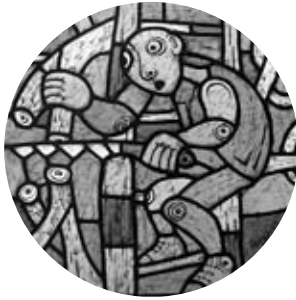
De snoeier. Glas-in-lood.

want als de zon schijnt gaat de intensiteit van de kleuren weg. Het glas bewerk ik met grisaille, waardoor het levendiger wordt.'