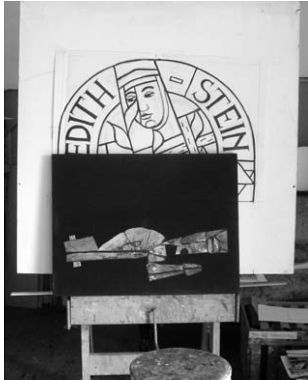
In het atelier: een ontwerp voor een glas-in-loodraam met Edith Stein en de statie 'de angstige' (Jezus in de hof van olijven).

Op het atelier haalt Sjef Hutschemakers uit kisten een kruisweg van 45 jaar oud, geheel geschilderd in zwart-wit. De eerste statie is helemaal zwart. 'In het begin was de duisternis. En het licht kwam in de duisternis. Ik heb de beelden genomen waar ik een sterk teken van kon maken, het vertellende element heb ik weggelaten en de essentie heb ik over gehouden. Het zijn collages: ik gebruikte een soort luchtpostpapier waar ik inkt en water overheen heb gestrooid, waardoor allerlei structuren heb ik een keuze gemaakt om het beeld op te roepen. Als het harmonisch in