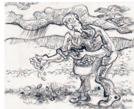
De tekening van de zaaïende boer die toont dat Hutschemakers zich sterk verbonden voelt met het boerenleven en moeder aarde

heb ik vooral van mijn vader. Daarbij hoort het gebruik van aardse kleuren als bruin en geel. Van mijn moeder heb ik meer het gevoel voor het spirituele, het mystieke en sacrale en daarbij horen etherische kleuren zoals lila. Vlak voor haar dood vroeg mijn moeder me waarom ik niet religieus schilderde. 'Dat doe ik toch', antwoordde ik. 'Je weet best wat ik bedoel', zei ze. En ik wist ook wat ze bedoelde: als je gelooft moet je dat ook expliciet uitdragen in je werk, en dat ben ik ook meer gaan doen: niet alleen impliciet religieus, maar ook expliciet."