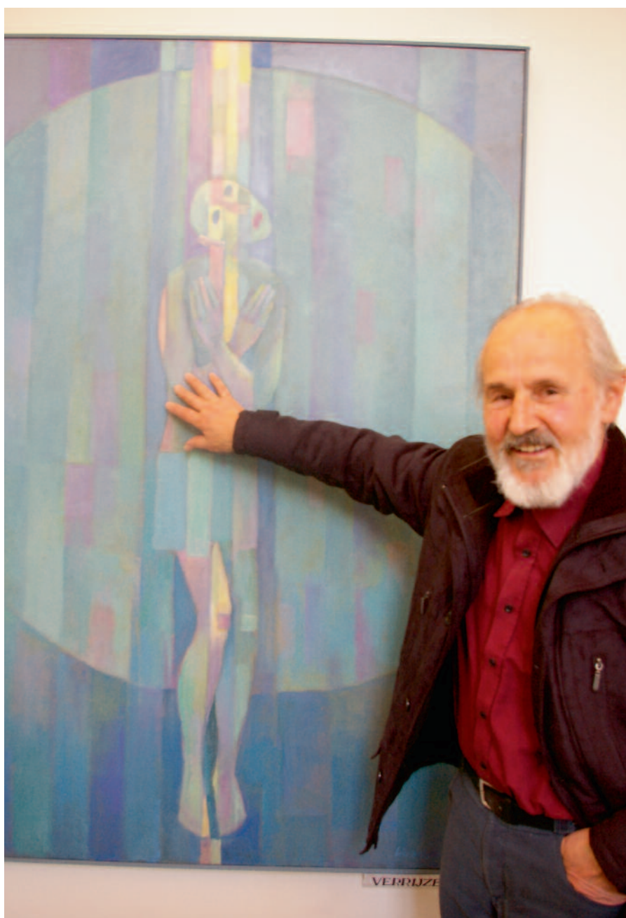
In zijn werk komt zijn geloofszin duidelijk tot uiting

Oplettende Limburgse kerkbezoekers zal dat ook niet ontgaan zijn: in verschillende kerken hangen zijn kruiswegstaties, zoals in Banholt, Heerlen en Maastricht. Zijn oudste kruisweg uit 1964 was met ander religieus werk te zien gedurende de hele Veertigdagentijd tot en met 1 mei in het Franz Pfanner Huis, een voormalige kapel in Arcen. De laatste jaren ontwerpt de kunstenaar ook veel glas-in-loodramen. Zijn grote, kleurrijke ramen zijn ondermeer te zien in parochiekerken in Neerbeek, Rimborg, Schinnen en Stramproy.